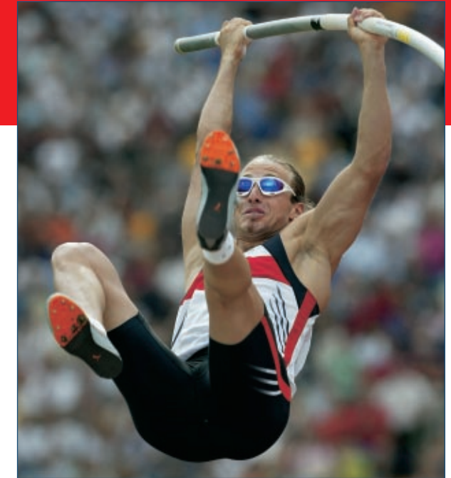
Tim Lobinger (GER), Hallen-Weltmeister 2003 und Sieger mit 5,91 m beim Weltfinale in Monte Carlo 2003