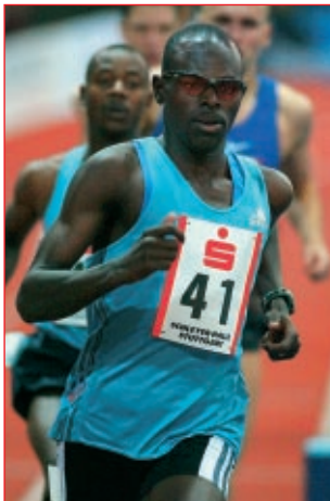
Wilfried Bungei (KEN), Sparkassen-Cup-Gewinner 2003 über 800 m

Hundertstel-Sekunden und Millimeter entscheiden am Ende - denn die Konkurrenz beim Sparkassen-Cup ist groß und hochkarätig. Im Jahr 2003 wurde der Sparkassen-Cup erneut zum weltbesten Hallen-Leichtathletik-Meeting ernannt und auch zur 18. Auflage werden wieder internationale Stars, Welt- und Europameister aus nah und fern erwartet. Klingende Namen, packende Fights und vor allem ein begeistertes Publikum – die Voraussetzungen für ein großes Ereignis sind geschaffen.