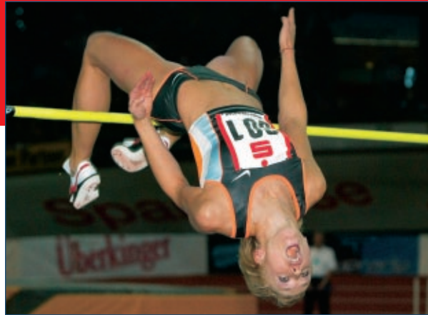
Kajsa Bergquist (SWE), Hallenweltmeisterin 2003 in Birmingham, die 27-Jährige ist eine der ganz großen Favoritinnen

Weltbestes Hallen-Leichtathletik-Meeting 2003